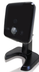
Caméra avec vision nocturne

Grâce aux caméras intelligentes de surveillance résidentielle, vous pouvez voir ce qui se passe chez vous par l'entremise de l'écran tactile, du centre de contrôle web ou des applications pour téléphone intelligent. Prenez des photos et enregistrez des clips vidéo lorsqu'un capteur se déclenche et même programmez une règle pour ce faire automatiquement à des moments précis ou lorsque l'alarme est déclenchée. Pour protéger votre vie privée, le poste de surveillance central ne peut visualiser aucune image, photo ou vidéo de la caméra intelligente de surveillance résidentielle.